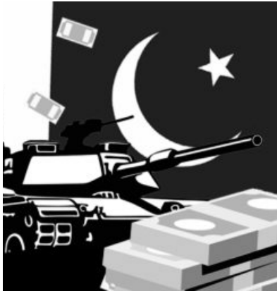
ILLUSTRATION: ARIANA MOHAMMAD

New Delhi is likely to highlight multiple commissions and omissions by Pakistan,